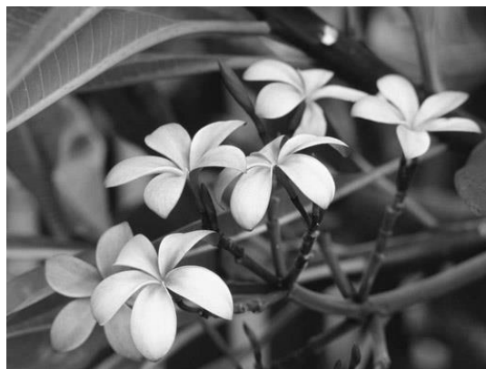
写真1 写真のサンプル